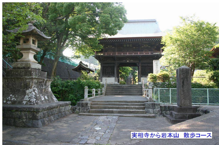
実相寺から岩本山 散歩コース